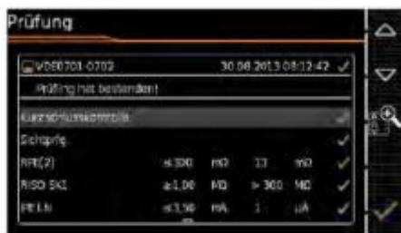
Test resultaten na testverloop